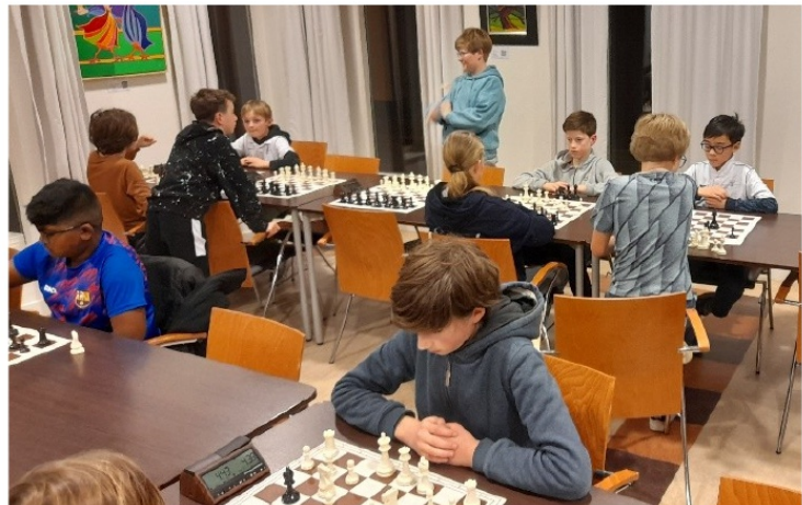
Enkele sfeerbeelden van de spanning die op de gezichten valt af te lezen.